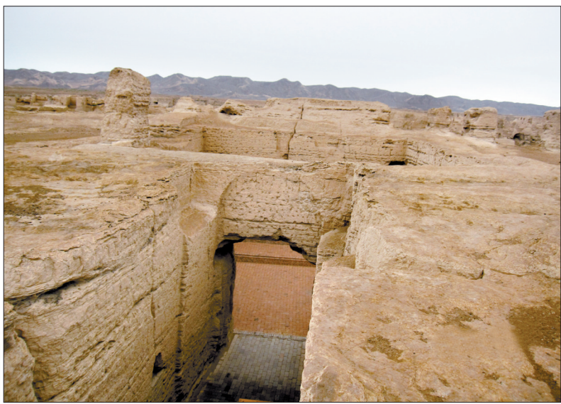
交河故城遗址

吐鲁番,火焰山的故乡,一个写满传奇的地方。古代丝路要冲的高昌之地,就在吐鲁番。近日,笔者随《洛阳晚报》组织的“重走丝绸之路”文化采风团到达吐鲁番,考察了高昌故城、交河故城、柳中城、阿斯塔那古墓群、柏孜克里克石窟等汉唐时期的文物遗迹,在这里处处可以看到洛阳的印记,感受到洛阳与吐鲁番源远流长的文化交流史。