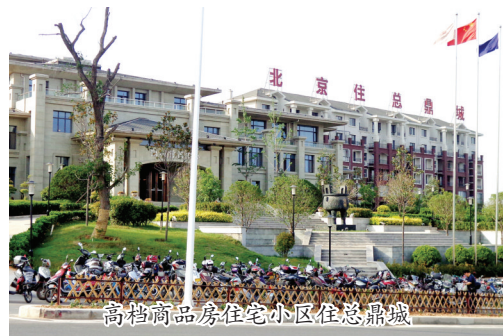
高档商品房住宅小区在总鼎城

“百强特色乡镇”“发展民营经济先进乡镇”“招商引资先进单位”“非公有制经济先进乡镇”“牡丹生产先进单位”……近年来,邙山办事处的特色和魅力随着洛阳市的发展,不断走出自己的特色,邙山办事处的发展说到底还是洛阳发展的一个缩影,更是邙山人不断进取的结果。(孙亚楠)