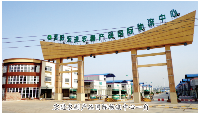
宏进农副产品国际物流中心一角

“花开时节动京城”“洛城无处不飞花”……这些诗句都能让人联想到牡丹给洛阳城带来的生机,但是很多人不知道,随着历代帝王的兴衰,洛阳牡丹也经历了发展和受摧残的过程,洛阳牡丹只剩下30多个品种,数量不足千株。虽然新中国成立后,洛阳牡丹获得新生,但是发展步伐缓慢。1983年洛阳市举办首届牡丹花会时,