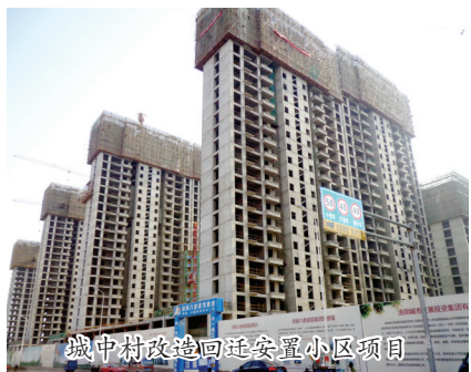
城中村改造回迁安置小区项目