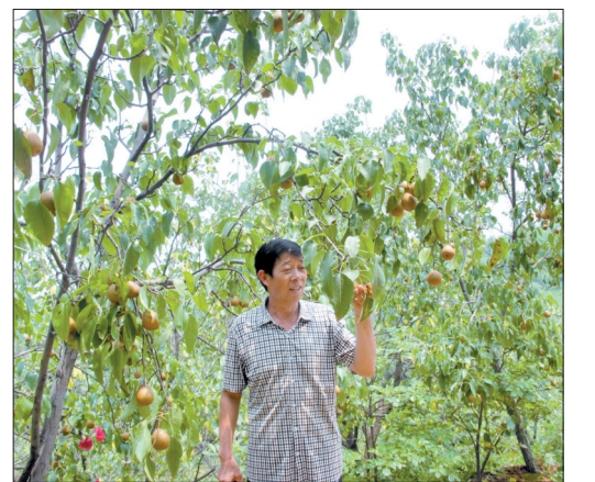
诸葛镇苏沟村的梨园