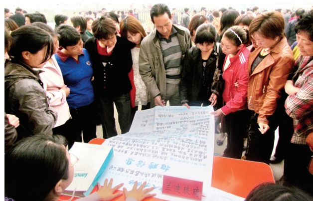
伊滨区征迁居民就业专项招聘会现场