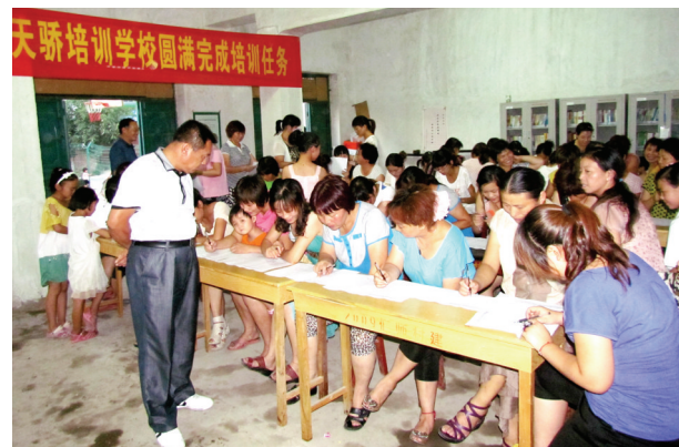
伊滨区佃庄镇关庄村中式面点培训班结业考试现场