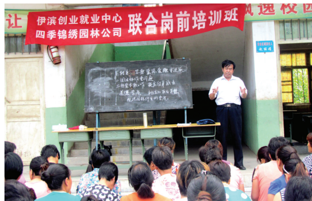
诸葛镇王府村花木种植养护培训班开班现场