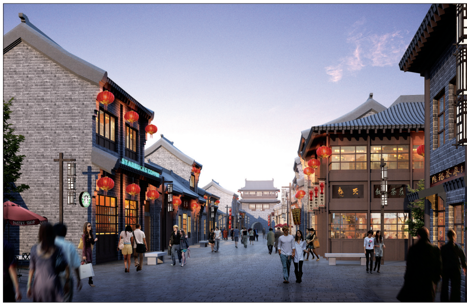
项目建成后的历史文化街区一景(效果图)