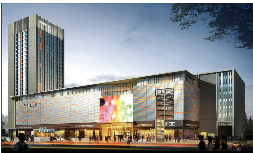
洛阳建业凯旋广场效果图(资料图片)

全市企业发展和项目建设环境专项治理电视电话会议召开以后,该区从省“百高百强”企业、区重点企业、龙头企业等重点信息中筛选确定了88家企业,由区县处级领导分包联系。今年上半年,区优化办先后向区“八大提升工程”92个重点项目涉及重点企业派出首席服务官92名。区纪委监察局开展“千企走访”活动,组成10个组每月走访100家企业,对领导干部分包企业和企业发展环境优化情况进行监督。