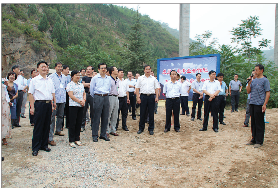
与会领导实地观摩

作为国家级贫困县,如何“变资源为资本、变活树为活钱、变青山为金山”一直困扰着嵩县的广大干部群众。近年来,嵩县紧抓集体林改机遇,大胆探索,勇于实践,大力发展绿色经济,走出了一条绿色兴县富民的新路子。