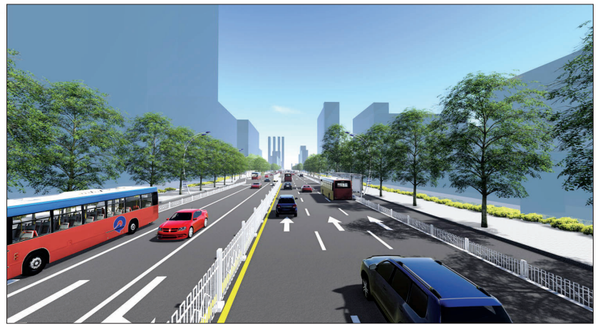
九都路改造后效果图