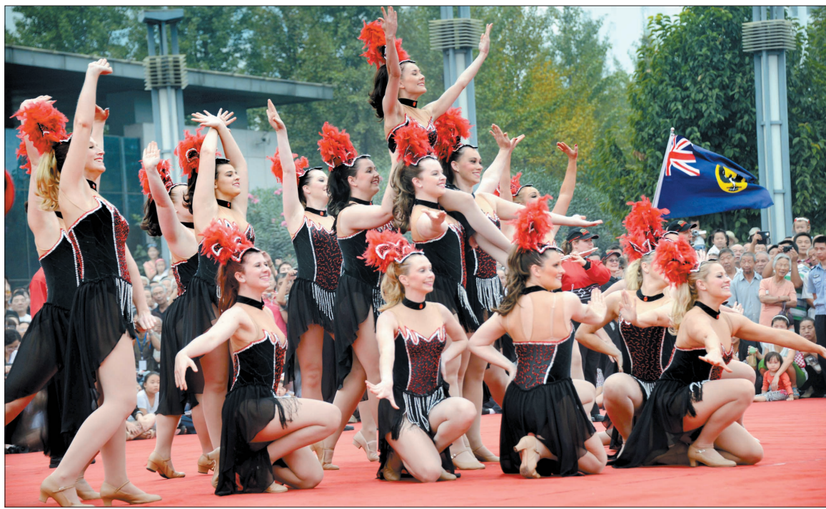
澳大利亚阿德莱德乐团演出的《乐队与舞者》

在历时一个半小时的表演中,其余8支表演团队还为观众献上了传统的大唐盛世舞龙、大里王狮舞、盘鼓、旱船毛驴、威武龙鼓《跑阵》等表演,为观众展现最原汁原味的河洛风情。本报记者 李岚/文