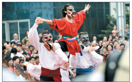
意大利奇诺伊美科拉民族舞蹈团表演的《节日的庆典》