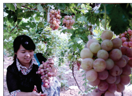
金秋时节,孟津县常袋镇千亩红提葡萄园里硕果累累,串串紫红色的美国红提葡萄