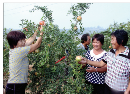
日前,在孟津县小浪底镇石门村软籽石榴基地,一串串红红的石榴压弯枝头,村民