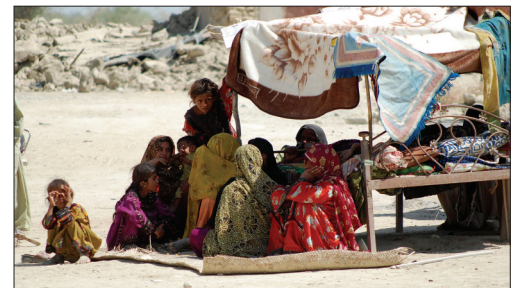
在巴基斯坦西南部的阿瓦兰地区,幸存者在房屋废墟旁休息。据当地官员说,截至北京时间25日21时,地震已造成327人死亡。

李克强在慰问电中说,惊悉贵国俾路支省发生7.8级地震,造成重大人员伤亡和财产损失,我深感痛心。我谨代表中国政府和人民,并以我个人名义,对遇难者表示沉痛哀悼,对遇难者家属和伤员表示诚挚慰问。相信在阁下的领导下,巴基斯坦政府和人民一定能战胜灾害,重建家园。中国政府愿根据巴方需要提供紧急援助。