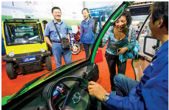
“大阳”电动四轮车成了抢手货