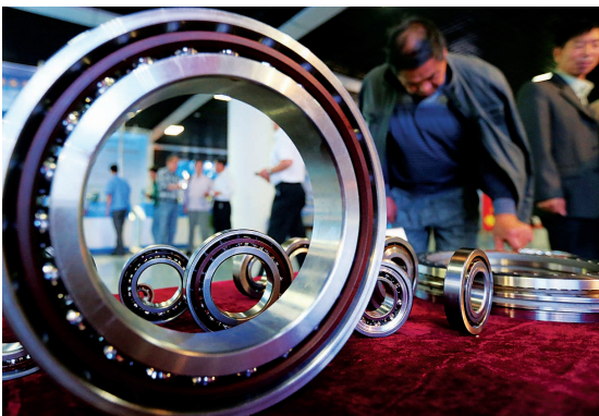
洛轴公司新洛轴生产的系列轴承闪亮登场

本报讯(记者 张锐鑫)在昨日开幕的2013中国(洛阳)工业博览会暨首届铝硅质耐火原料博览会上,我市企业的工业产品争相登场,从填补国内空白的高铁专用轴承,到迎合环保趋势的燃气发电机组,一个个洛阳创新产品让人目不暇接。