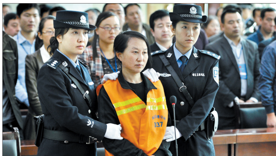
龚爱爱在法庭上受审

9月29日,备受关注的“房姐”龚爱爱案在陕西省靖边县人民法院一审宣判。被告人龚爱爱因伪造、买卖国家机关证件罪被判处有期徒刑3年。