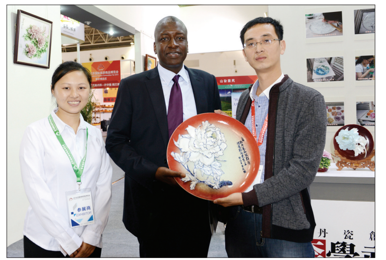
青花牡丹瓷受到外宾欢迎