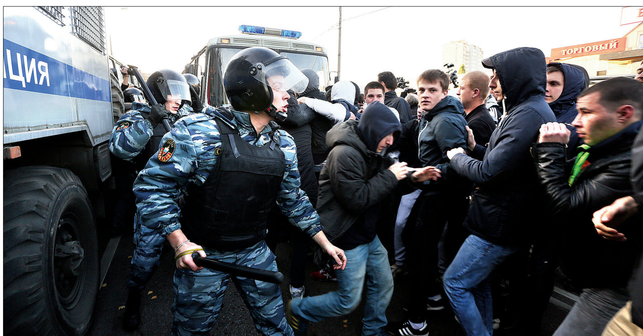
13日,在莫斯科,警察试图阻挡参与骚乱的民众