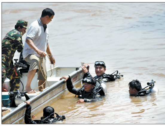
17日,在老挝南部的巴色市湄公河河段,潜水员搜寻坠机遇难人员的遗体

综合新华社万象10月17日电 老挝航空公司首席执行官宋赞17日在老挝首都万象举办的新闻发布会上通报了失事客机44名乘客国籍信息,包括两名中国乘客,其中一人来自中国台湾。