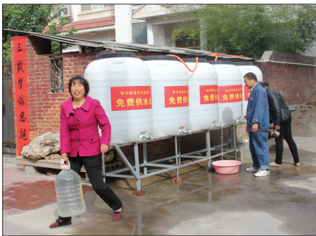
便民接水点