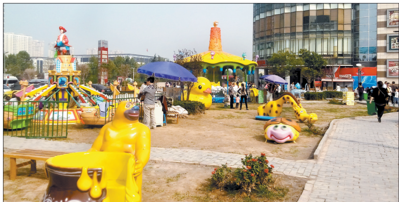
在新区某商场附近的小型儿童游乐园吸引了不少孩子和家长