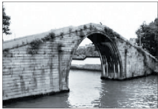
苏州吴门桥,杨荫榆被日本兵杀害于此

▲ 1935年,杨荫榆倾尽全部积蓄,在苏州创办二乐女子学术研究所,要求学生“注重道德品性,真才实学,崇尚朴实”是她最后的教育理想