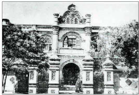
杨荫榆曾担任校长的北京女子师范大学

1926年,时任北京女子师范大学校长的杨荫榆,因对参加民主进步运动的学生进行压制和打击,遭到校内包括鲁迅在内的师生和社会人士谴责,被轰下校长宝座。抗日战争爆发后,当时寓居苏州的杨荫榆目睹日军的种种暴行,向日方提出抗议,并挺身而出保护自己的同胞,最终于1938年1月1日被日本兵杀害。