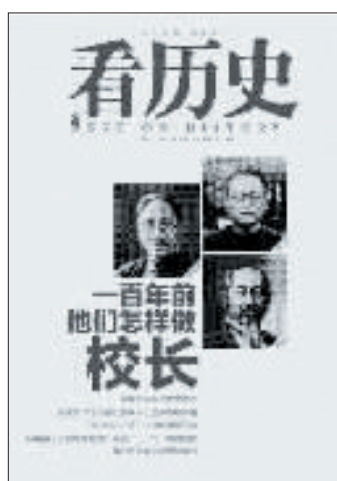
(本文摘自《看历史》,作者顾浩,2013年9月出版)

“驱羊(杨)运动”的导火索,是1924年秋季杨荫榆以“整顿校风”的名义,开除了几名暑假后未能按时返校的国文系学生,引发了学生的集体不满,风潮由此酝酿而生。但这场持续了两年多的女师大风潮,并不仅是校纪整顿这么简单,其背后关涉的是不同教育理念的冲突和高等教育环境的变化,并与“五四”以来中国社会思潮的发展与分化密切相关。(据《中华读书报》)