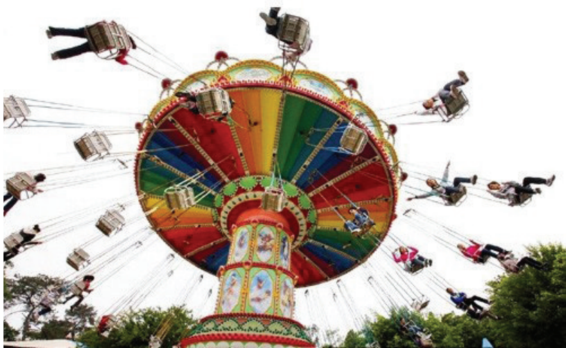
外地的方特游乐园吸引了许多游客。(资料图片)

香港迪斯尼乐园、深圳欢乐谷、杭州未来世界、郑州方特乐园……随着各地以游乐场为主的主题公园渐渐增多,其顾客群也从少儿逐渐扩大到青年人,甚至中老年人。洛阳游乐经济规模较小的现状如何改变?可否兴建大型游乐场?记者近日进行了走访。