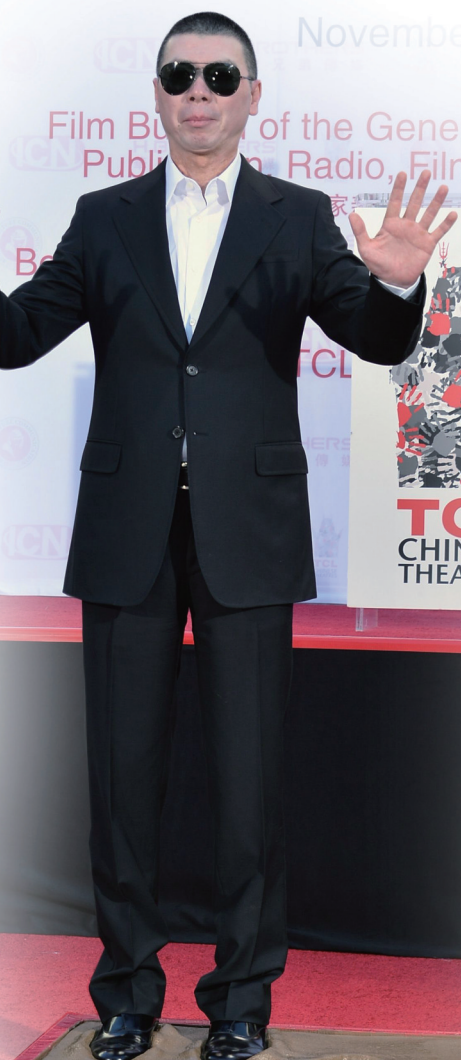
冯小刚在好莱坞留下脚印

冯小刚:我真的是大荣幸了。也许是为了吸引游客吧?在洛杉矶有很多很多中国游客,也许他们想让这些中国游客在拍照的时候多一点亲切感吧。