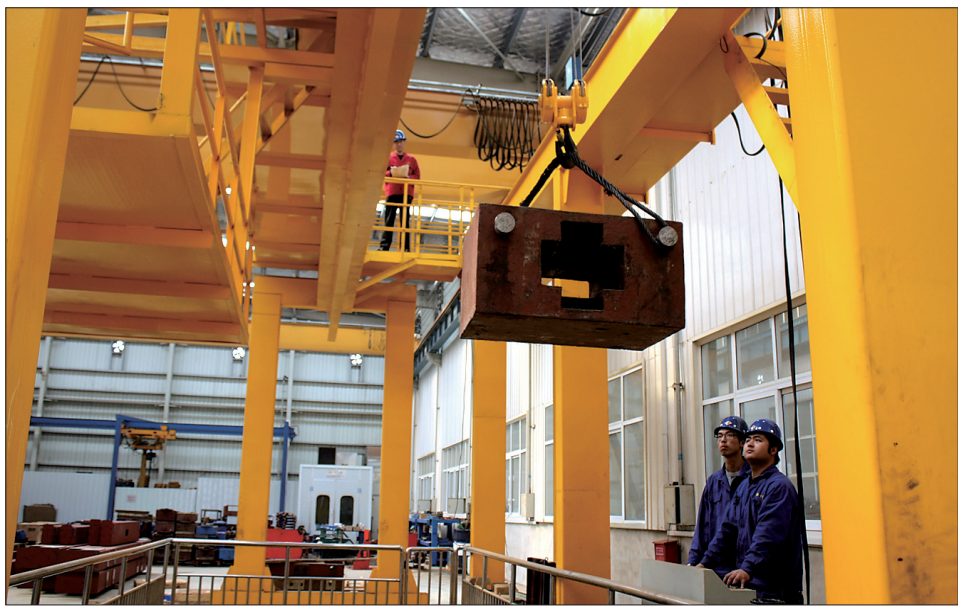
位于洛龙产业集聚区内生产技术全国领先的洛阳卡瑞起重设备有限公司生产车间

项目建设全面推进。1月至9月,全区共实施千万元以上项目200个,总投资1102.9亿元。其中,亿元以上项目135个,总投资1079.4亿元。滨河南路、东环快速一期等43个项目已竣工投用;中航光电一期、恒生科技园一期等项目基本建成;2×350兆瓦阳光热电站工程、正大城市广场市民中心、恒和国际会展中心等119个在建项目有明显形象进度。城市建设扎实有效。截至10月底,全区累计完成征迁379万平方米。蓝天化工厂区