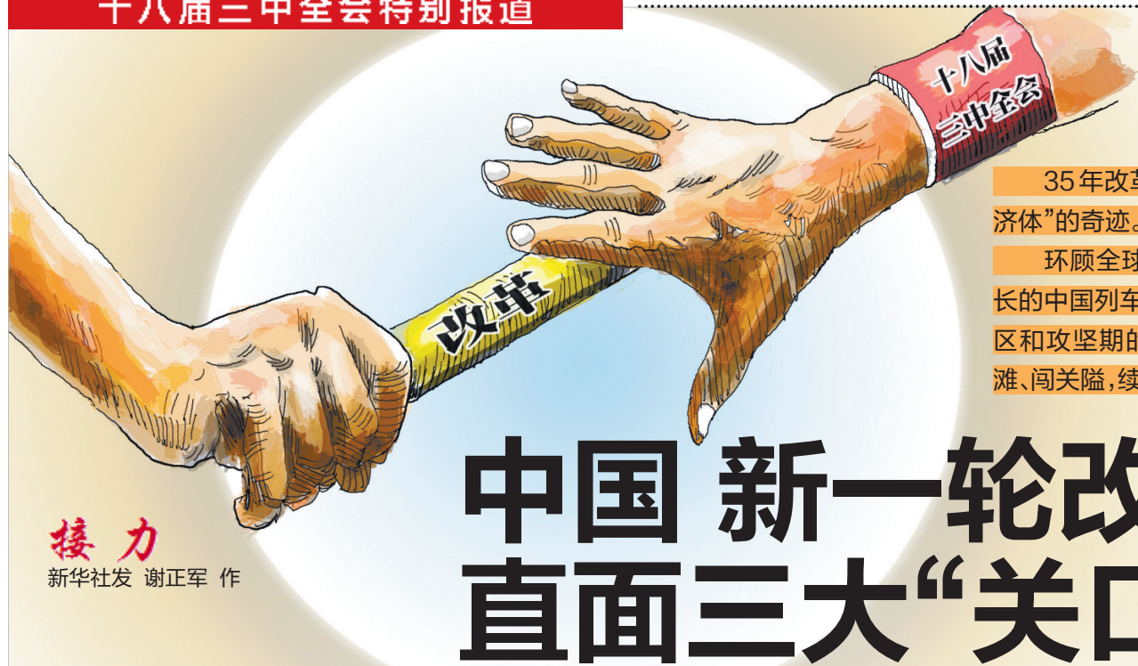
接力 新华社发 谢正军 作