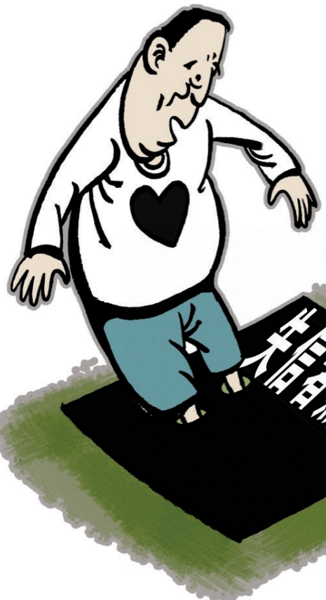
铜 高海春 作