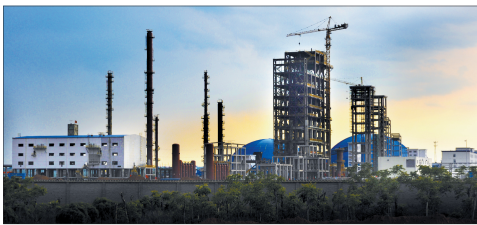
位于孟津县的河南能源化工集团年产20万吨乙二醇项目

定为“城市矿产”示范基地的重大机遇,加快发展废旧钢铁、废旧电器、报废汽车、废旧塑料、稀贵金属回收利用,建设中部地区最大的再生资源基地。