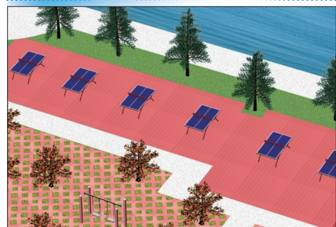
乒乓球健身园效果图