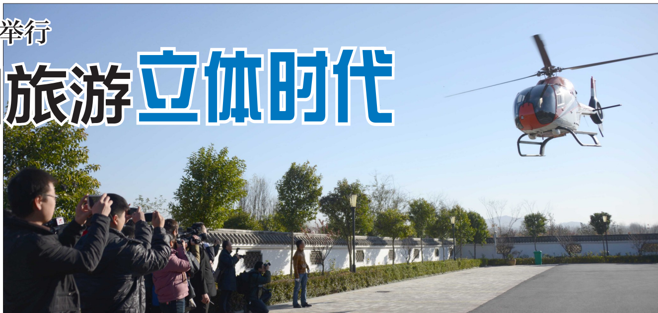
游客乘直升机体验低空旅游