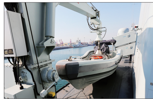
舰上装备的冲锋艇