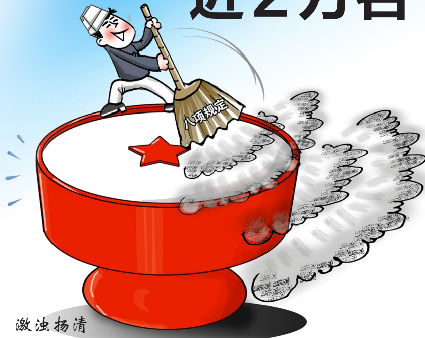
激浊扬清 新华社发 赵乃育作

新华社北京12月2日电(记者 赵越)2012年12月4日,中央政治局会议一致同意关于改进工作作风、密切联系群众的八项规定,如今已近一年。记者2日从中央纪委党风政风监督室获悉,截至今年10月底,各地查处违反中央八项规定精神问题共计17380起,处理19896人,给予党纪政纪处分4675人。