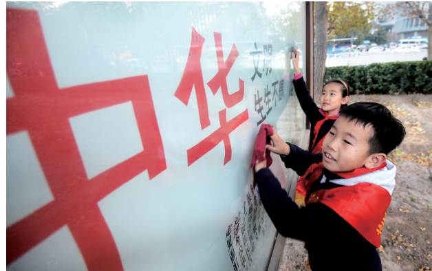
昨日是国际志愿者日。当天,西工区教体局组织中小学开展志愿服务活动。图为小学生在清洁公益展板。 刘冰 裴胜利 摄