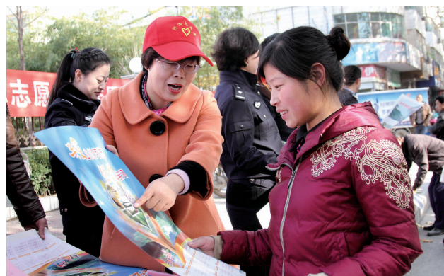
近日,洛宁县文明办组织各级文明单位的志愿者50余名,开展以“关爱自然,保护母亲河”为主题的宣传活动,发放印有洛宁自然风景、珍稀动植物的宣传挂历、彩页,倡导“爱卫、护绿、环保”,共同建设和谐美好家园。