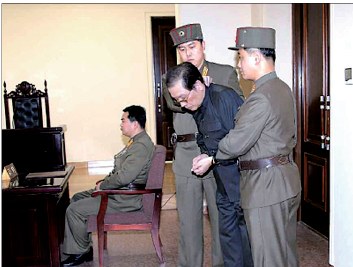
这张十三日朝鲜《劳动新闻》网站公布的照片显示,朝鲜国家安全保卫部特别军事法庭十二日对张成泽的罪行进行审理。

判决书说,张成泽将窃据内阁总理职务作为其妄图篡夺党和国家最高权力的第一步,为此企图通过使其主管的机构独揽国家经济重要领域来架空内阁,从而把国家经济和人民生活推入无法收拾的破产局面。他无视金正日在第十届最高人民会议第一次会议上树立的新的国家机构体制,把内阁所属监督检查机构纳入他的旗下,全部掌握和肆意宰设立和取消委员会、省、中央机关和道、市、郡级机构,成立贸易及创汇单位和驻外机构等,篡夺了原由内阁负责的一切有关机构编制工作,导致内阁无法圆满发挥作为经济司令部的职能和作用。