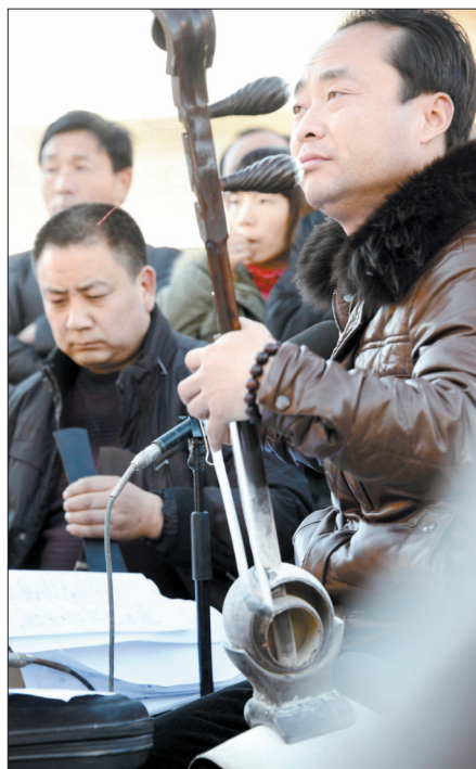
两个多小时的演出,乐队“一坐到底”