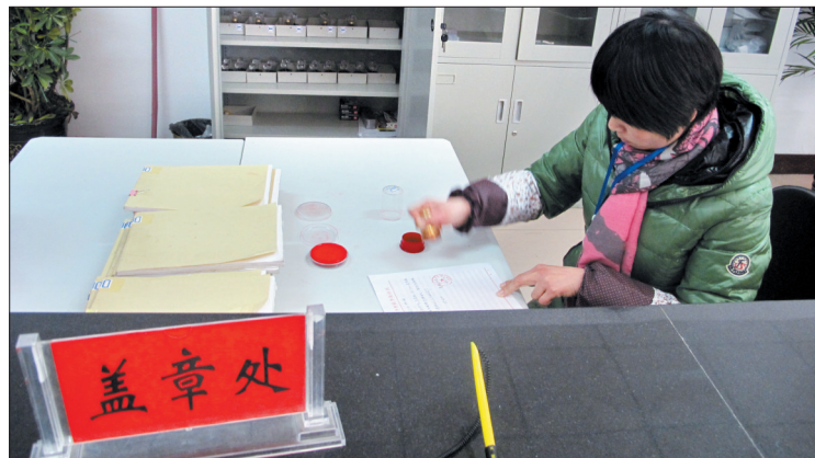
伊滨区李村镇便民服务中心盖章处

农村集体“三资”(资金、资产和资源)是村级经济社会发展的重要基础,涉及人民群众的根本利益。近年来,随着经济社会的发展,我市乡村快速发展,如何管理农村“三资”成为群众关心的热点。针对暴露出的白条入账、开支不规范等问题,今年我市对全市3161个行政村和社区进行了村级干部执行财经纪律检查,并将逐步推广依靠网络技术,扩大公开范围等措施,通过“制度+科技”的方法提高农村资金管理水平。