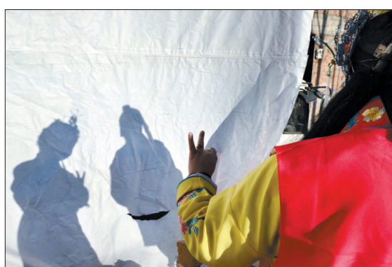
两位演员在后台对戏

近日,洛宁县豫剧团带着新编排的《秦雪梅再婚》来到长水乡,为当地群众送上一场精彩的演出。每年,洛宁县豫剧团都要编排一部新剧,《秦雪梅再婚》就是剧团今年新编排的,截至目前该剧已演出6场。