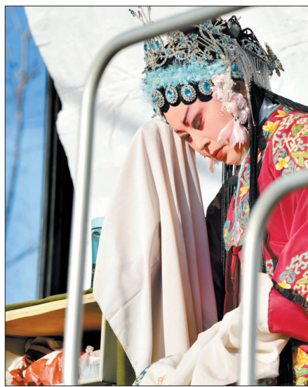
趁候场时打个盹儿