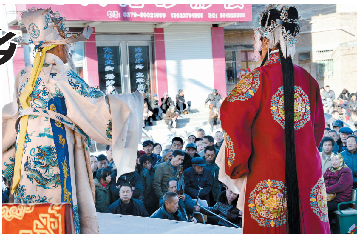
台上唱得卖力,台下看得认真