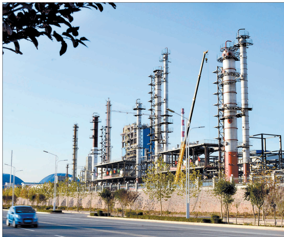
河南煤化工集团年产20万吨乙二醇项目

孟津县依托装机容量180万千瓦的小浪底、14万千瓦的西霞院两个水力发电站和120万千瓦神华国华孟津电厂及义煤集团孟津煤矿等能源电力龙头企业,绘制主导产业招商图谱,围绕拉长产业链条,开展上下游产业对外合作招商活动;在加快河南煤化工集团投资25亿元的乙二醇二期项目和投资100亿元的年产20亿立方米煤制天然气项目建设的同时,尽快启动投资10亿元、装机容量50兆瓦的歌美飒风力发电项目建设;在积极做好投资80亿元的2×1000兆瓦国华孟津电厂二期、投资15亿元的孟南煤矿和投资13