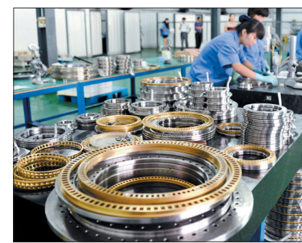
洛阳鸿元轴承科技有限公司技术人员在检测精密转台轴承

绕洛阳石化丰富的化工化纤原料,以石化后加工项目为龙头,以乙二醇下游产品为方向,加快正在建设的洛阳巨子新能源太阳能铸锭切片、洛阳奥利斯有色金属年产2万吨铝铁等项目进度,积极谋划投资10亿元的车用塑料配件生产项目、投资30亿元的石化后加工产业园项目、投资13亿元的精细化工产业园项目,努力打造精细化工产业集群;以投资5亿元的铜钨酸、仲钨酸项目建设为重点,加快洛钼集团钨钼产业园项目建设,着力打造钨钼材料集群,使其成为孟津经济的主支撑。