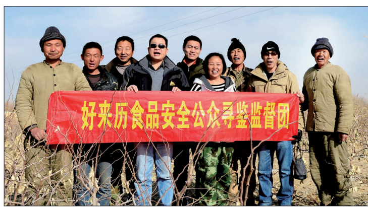
新疆和田枣园里的洛阳人

“出品城市优质生活”,好来厉团队一刻不敢懈怠。连日来,经过精心筹备,好来厉首发产品——新疆和田大枣、新