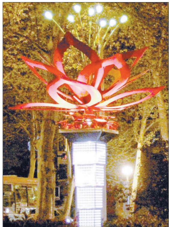
延安路上的牡丹灯