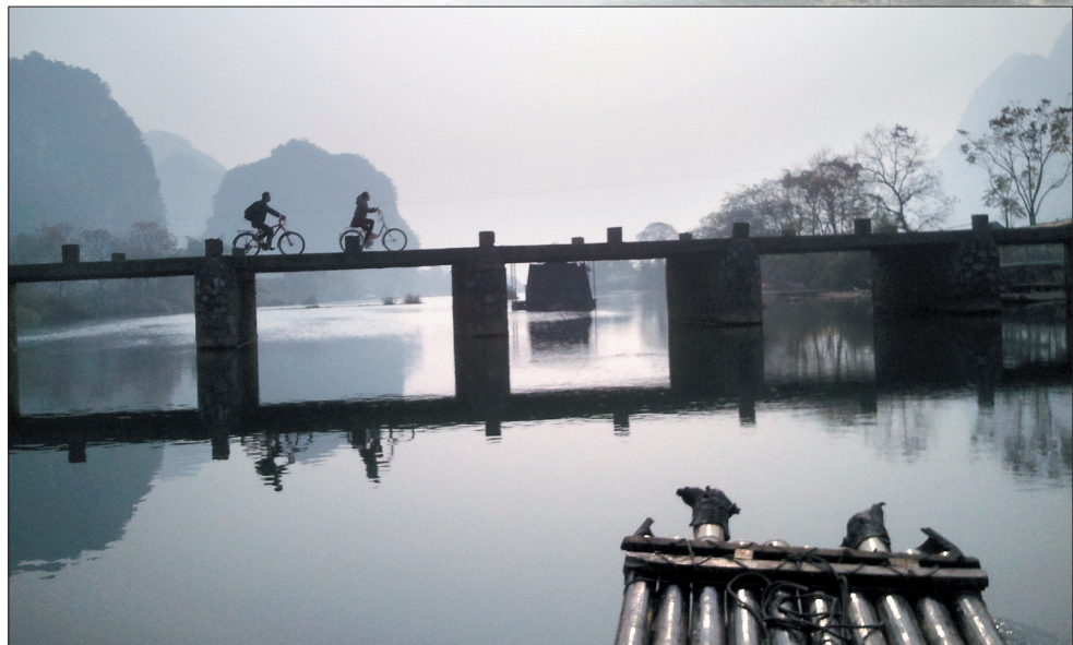
阳朔母亲河——遇龙河一景