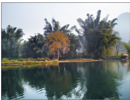
在桂林广为种植的风尾竹是周恩来总理当年专门从四川引进的