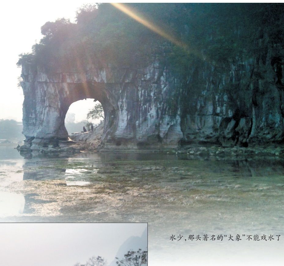
水少,那头著名的“大象”不能戏水了

一提起桂林,人们总会想到“桂林山水甲天下”,想象那里青翠的山、清澈的水,但我前几天到桂林时,正值冬日,又逢枯水期,游漓江时,感觉山不清,水亦不秀。不过,此次冬日桂林行,给我的印象还是不错的。