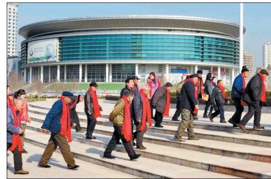
老人们参观新区