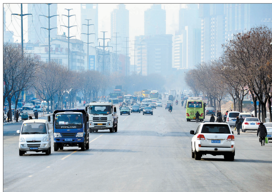
改造后的九都路