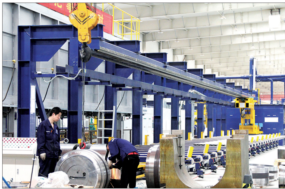
位于伊滨区的麦达斯轨道车型材及车体大部件项目一期已投产

昨日,我市召开县(市)区重点项目建设汇报会,各县(市)区主要负责人围绕产业集聚区重大项目、农业产业化龙头项目、商务中心区和特色商业区“两区”建设项目、城市旧城改造项目、重大基础设施项目、民生项目等方面工作进展进行了专题汇报。 在汇报会上,各县(市)区比成绩、比进度,找差距、找出路。大家纷纷表示,要始终坚持把项目建设作为推动县域经济社会发展的原动力,推进更多大项目、好项目、有带动力和影响力的项目落地,为洛阳建设名副其实的中原经济副中心城市做出更大贡献。