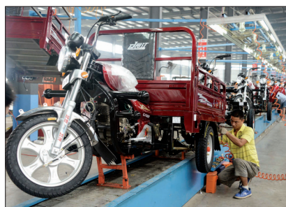
偃师盛江工业园三轮摩托车生产线