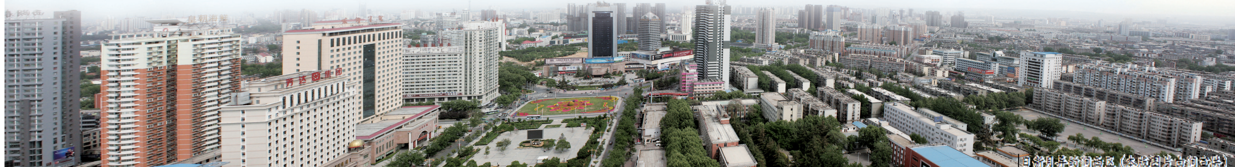
涧西区的现代化城市面貌