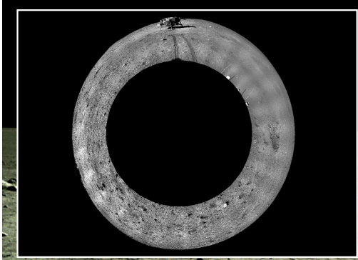
全景相机拍摄的巡视器周边360度范围的全景镶嵌影像图,采用方位投影方式表达(2013年12月23日摄)

1月10日,中国科学院首次公布通过降落相机、地形地貌相机、全景相机等载荷拍摄的一组月球照片。2013年12月14日至26日,嫦娥三号探测器搭载的八台有效载荷在第一月昼期陆续开机完成了探测或月面测试工作。探月工程地面应用系统和中国科学院为嫦娥三号任务组建的科学应用核心团队及有效载荷研制单位,对获取的测试数据进行了初步分析,表明各有效载荷工况良好,探测数据的获取、接收、传输、预处理正常,为嫦娥三号任务在第二月昼期全面开展科学探测打下坚实基础。第二月昼期从1月11日开始。届时,嫦娥三号将全面开展新一轮科学探测。