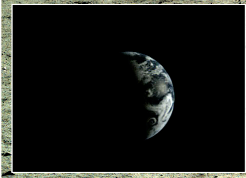
地形地貌相机拍摄的地球图像(2013年12月25日2时15分摄)