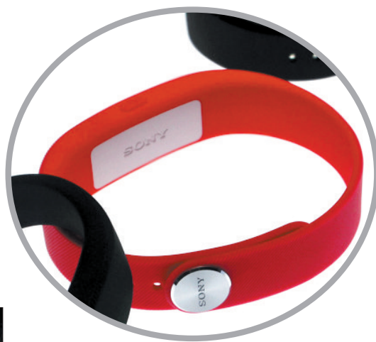
可记录用户日常生活中步行、跑步、行车、睡眠等信息的智能腕带