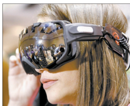
冬季运动护目镜配备了一个摄像机,可将佩戴者在滑雪时目之所及全部记录下来(本组图片为资料图片)