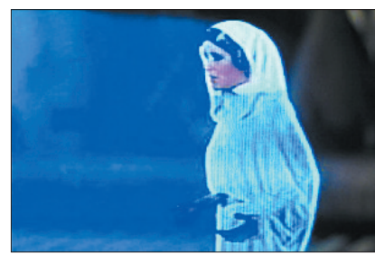
《星球大战》中莱娅公主的全息影像

1977年《星球大战》中莱娅公主的全息影像(真实再现物体的三维图像)出现在天行者卢克眼前,时隔30多年,这一离奇现象有望成为现实。目前,波兰莱娅显示系统公司最新提出全息影像电话概念,用户能够在线看到通话对方的实时3D图像。