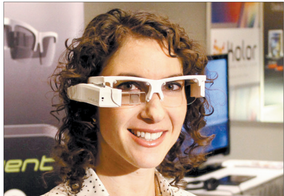
拥有陀螺仪、指南针、环境光传感器、GPS、Wi-Fi、蓝牙、麦克风和摄像头的智能眼镜

每年的国际消费电子展都会成为当年世界消费电子产品和技术的风向标。在今年的国际消费电子展上,总计展示15大类科技电子产品,有2万多种新产品发布问世,其中智能手表、智能腕带、智能眼镜、智能手机等可穿戴设备成为主角。(据《科技日报》)