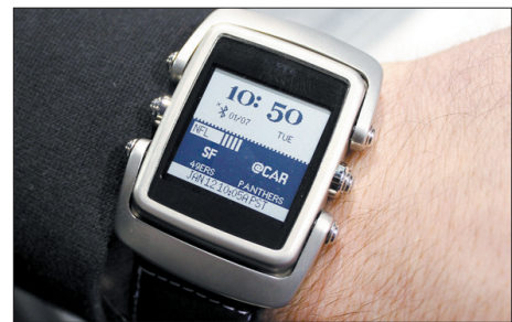
支持来电、邮件、天气和股票提醒的智能手表