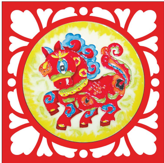
龙马迎新(彩瓷) 郭爱作

“红旗招展九州画,龙马奔腾万里春。”马年春节正向我们走来,马年谈马,成为新年的重要话题。而谈马,总要谈及龙马负图的传说。据说,伏羲氏时,龙马出于黄河孟津,其身上的旋有次序,形数有异别,这就是河图,伏羲据此而创制了八卦,开启了文明。“龙马精神传百代,鲲鹏志向搏九天。”而“龙马精神”一词也出自洛阳,它就是河洛文化的精神内涵。