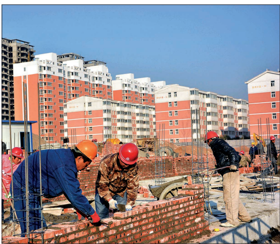
保障房项目凤祥小区加紧施工