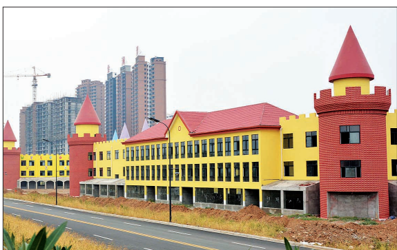
即将建成投用的儿童世界