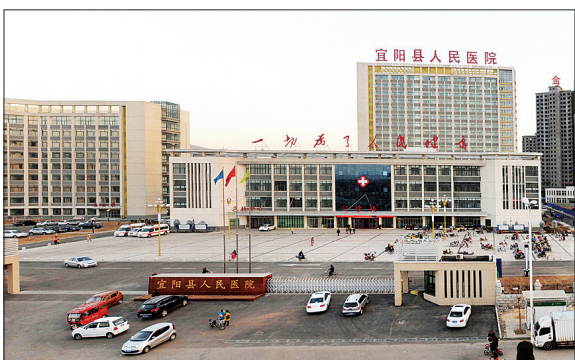
新建成投用的宜阳县人民医院

截至2013年年底,该县拥有国家级畜牧产业化龙头企业1家、省级5家、市级4家,注册50万元以上的养殖场67家,畜牧专业合作社13家。涌现出农民养殖户11206户,全年生猪、牛羊、家禽出栏量分别达57万头、20万头(只)、210万只,实现畜牧业产值22亿元,10.7万养殖户人均畜牧业收入达2700元。