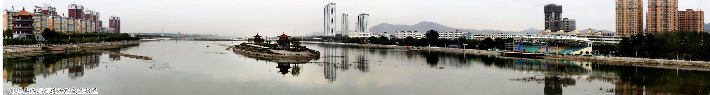
宜阳县洛河河道治理成效初显