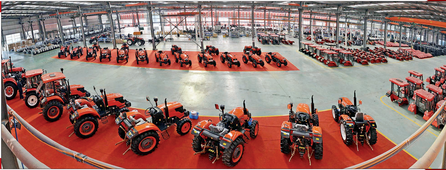
位于宜阳县产业集聚区的洛阳丰收农业机械设备有限公司正在加紧生产

该县2013年预计全年完成生产总值200.5亿元,同比增长8.5%;规模以上工业增加值63.7亿元,增长13.5%;固定资产投资210.5亿元,同比增长23%;公共财政预算收入达7.24亿元,增长17.1%;城镇居民人均可支配收入19540元,增长11.5%;农民人均纯收入6810元,增长11.6%。