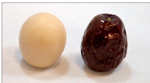
好来历新疆和田特级大枣个头堪比鸡蛋

好来历新疆和田特级品数量有限,每箱4袋,每袋500克,售价每箱398元。 好来历24小时服务热线:洛阳日报报业集团“百姓一线通”0379-66778866。