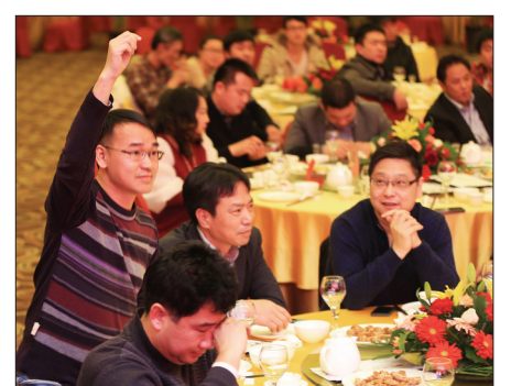
现场抢订十分踊跃