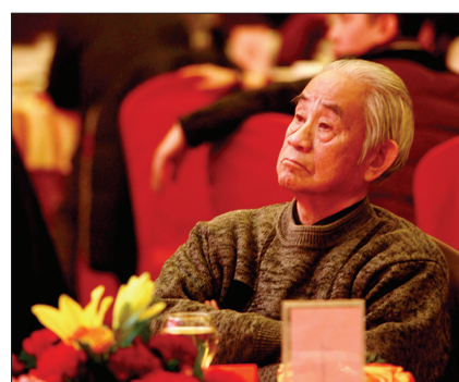
著名教育家、作家、学者叶鹏在首发式上