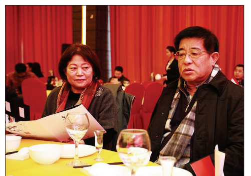
著名画家王绣、文柳川在首发式上