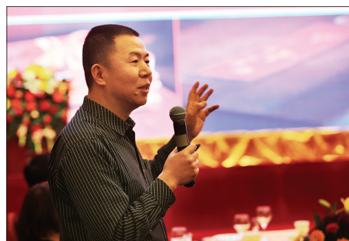
省文联副主席、省美协副主席兼秘书长刘杰在首发式上讲话