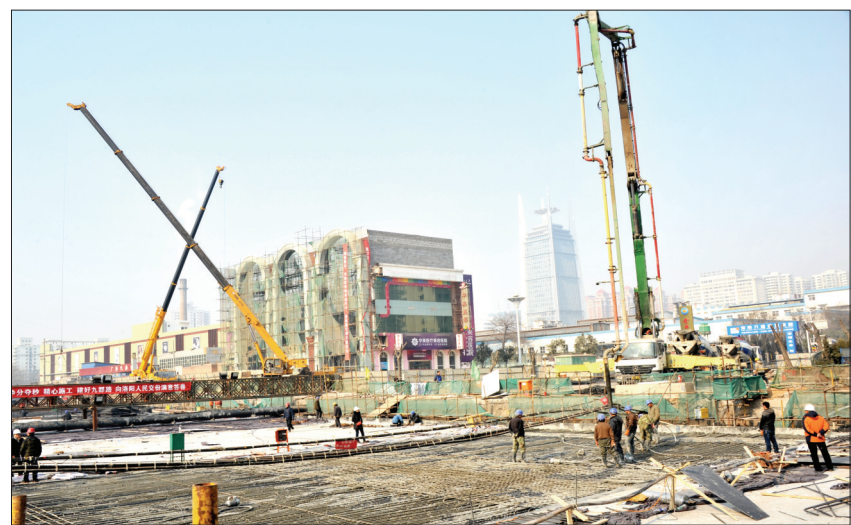
随着顶板混凝土浇筑完成,框架桥主体实现全面封顶