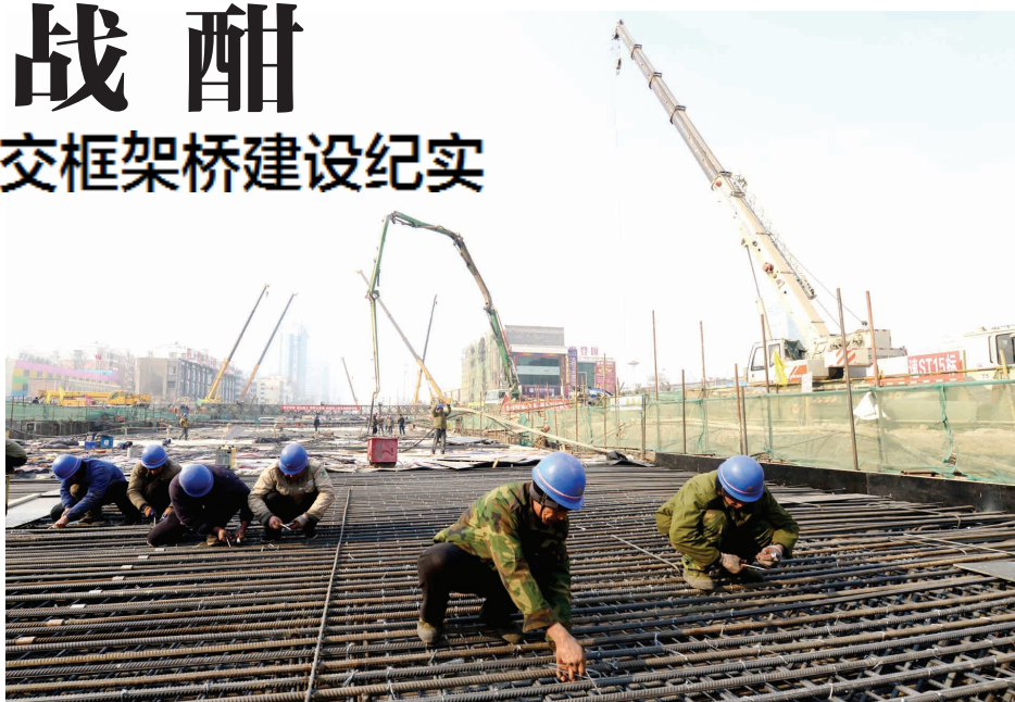
九都路下穿解放路立交框架桥施工现场

谈起资金投入,他说,春节前后,集团公司需要花的钱很多,但资金比较短缺,在这种情况下,集团公司自己想办法,积极筹措了1.7亿元,确保了该项目顺利进行,这也充分体现了河南六建集团公司较强的社会责任感。谈起员工队伍,更有三个“特别”:特别能吃苦,特别能战斗,特别能奉