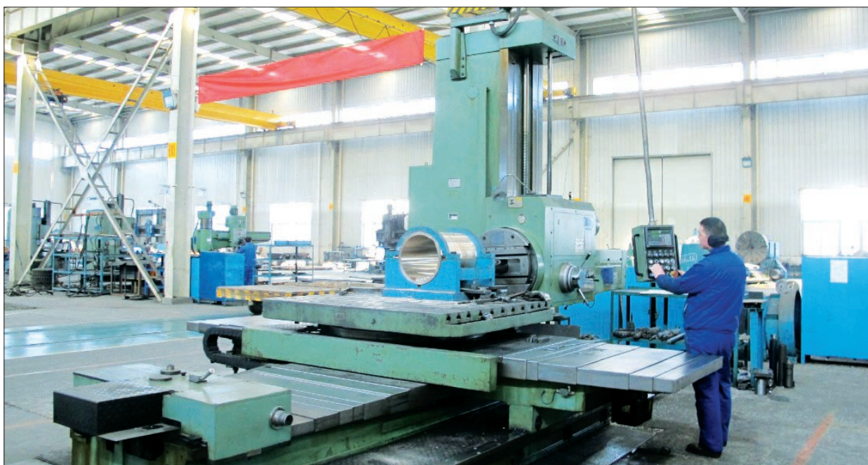
大华重机机械加工车间

在引进高端技术产品的同时,大华重机还聘请合作伙伴专家到公司蹲点培训指导,公司技术人员定期到国外交流学习,及时带回先进的设计理念、技术及制造经验。这一“走出去学习,请进来指导”的合作方式,使大华重机的产品质量水平快速提升。