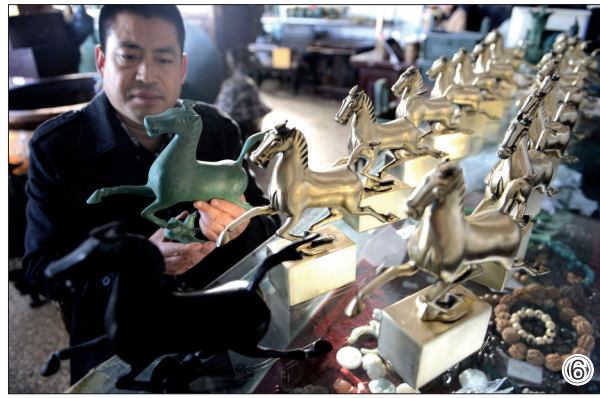
图① 蜡模 图④ 熔炼 图② 浇铸 图⑤ 打磨 图③ 焊接 图⑥ 成品