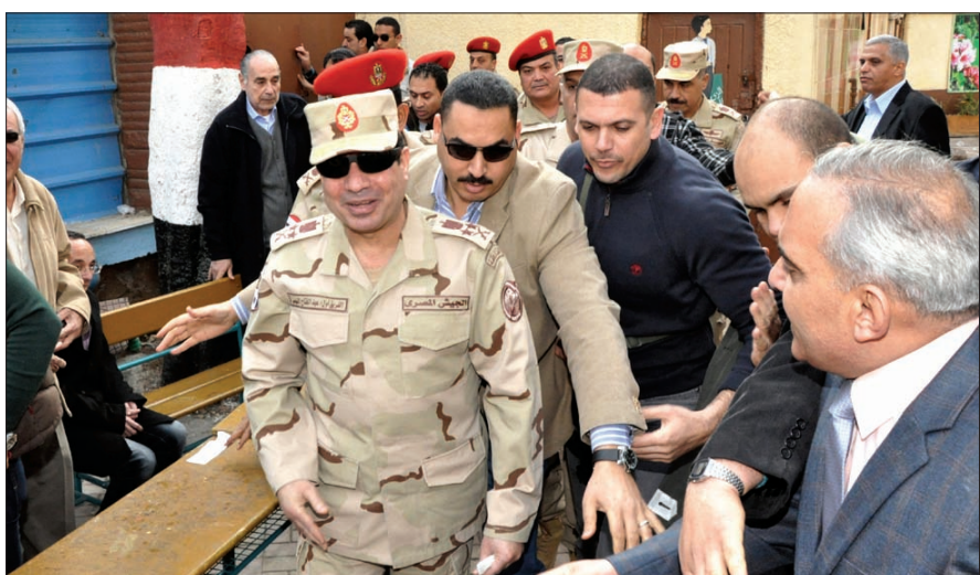
埃及临时政府总统曼苏尔1月27日签署总统令,授予第一副总理兼国防部部长塞西元帅军衔,这是埃及军队的最高军衔。这是塞西(前左)14日造访开罗一处埃及新宪法草案公投投票点的资料照片

士兵的汽车在西奈省遭武装人员伏击,4名士兵死亡。26日,穆尔西支持者与军方支持者在开罗北部发生冲突,致死49人。同一天,军方一架直升机在西奈省遭导弹袭击坠毁,5名士兵丧生。