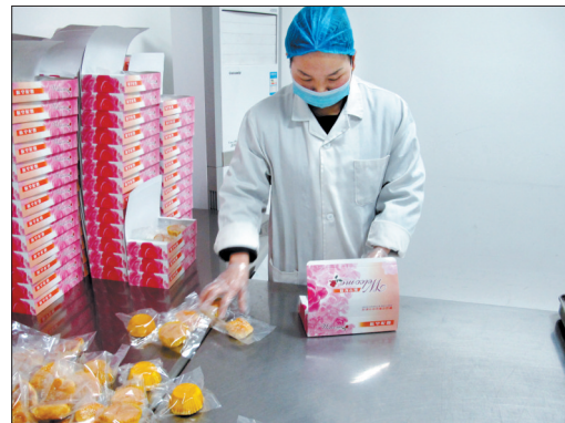
他们为节日忙碌着