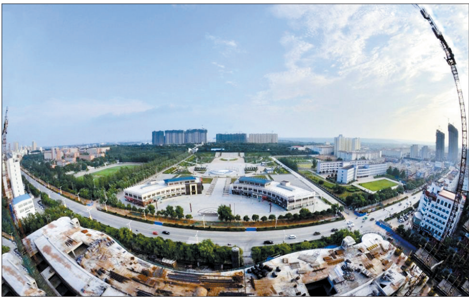
正在崛起的县城新区(资料图片)

新的气势。 这个“气势”,既包括工作思路的持续和拓展,也包括有利条件的集聚和显现,更包括全县千群良好的精神状态和高涨的创业士气,孟津的人气、商气不断提升,发展正能量与日俱增。孟津大地一股求新、