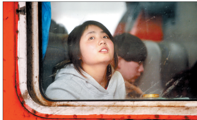
搭上节前回家的“末班车”

据新华社北京1月29日电 外交部发言人华春莹29日就香港特区政府即将对菲律宾采取制裁措施表示,中央政府支持香港特区政府妥善解决“8·23”人质事件善后事宜的努力,敦促菲方尽早解决有关问题。