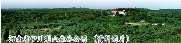
河南省伊川栾山森林公园(资料图片)

该园位于县城西北部,南起西水上乐园、北至西南环高速绿色廊道、东至先锋渠、西至洛栾高速景观廊道。园区南北长约14公里,东西宽2公里至4公里,涉及城关镇、鹤岭乡2个乡镇40个行政村,规划面积2万亩,2014年完成8000亩。