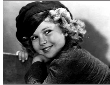
秀兰·邓波儿(资料图片)